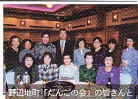
野辺地町「だんごの会」の皆さんと