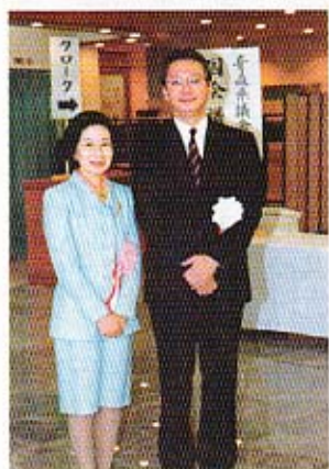
夫婦でお出迎え 少し緊張気味？