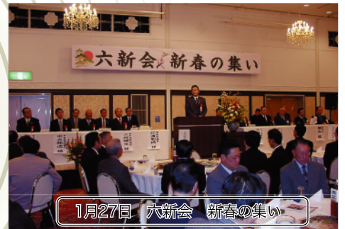
1月27日 六新会 新春の集い