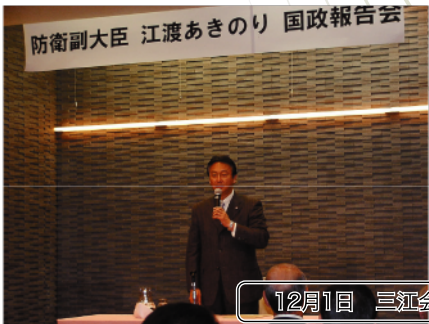
12月1日 三江会国政報告会