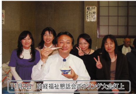
11月2日 政経福祉懇話会ボウリング大会打上