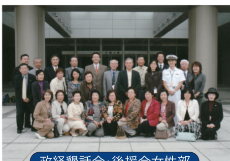
政経懇話会・後援会女性部