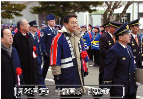
1月20日(日) 十和田市 出初式