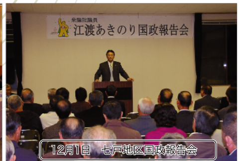
12月1日 七戸地区国政報告会