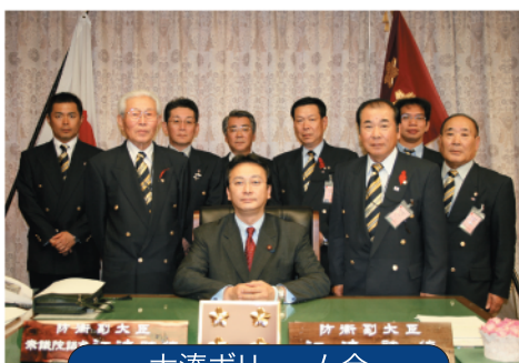
大湊ボリューム会