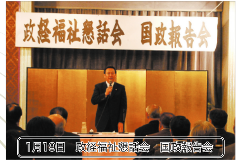
1月19日 政経福祉懇話会 国政報告会