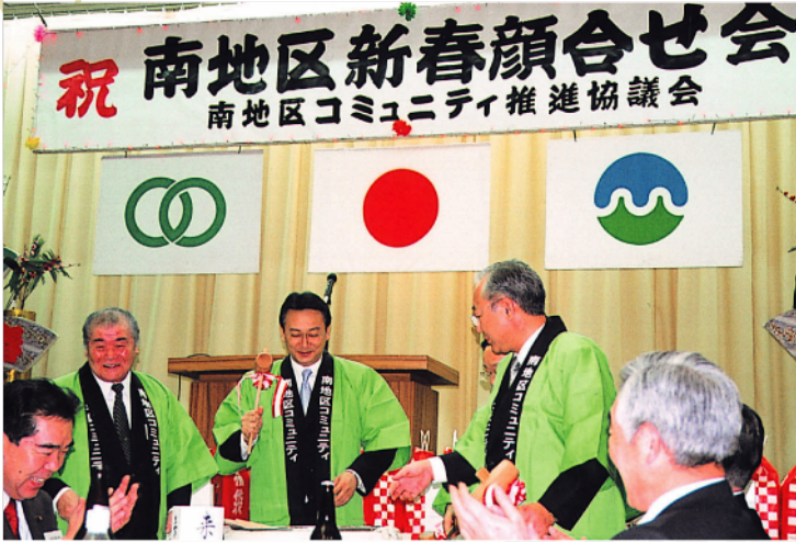
十和田市南地区コミュニティ推進協議会主催「新春顔合わせ会」にて