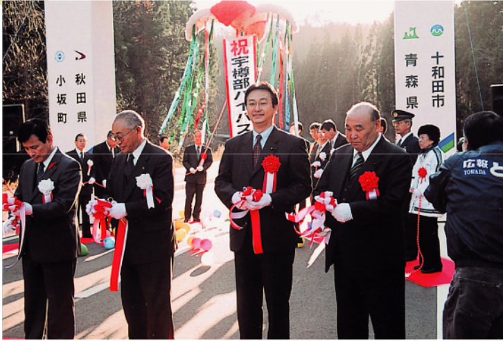
十和田市宇樽部バイパス開通式にて