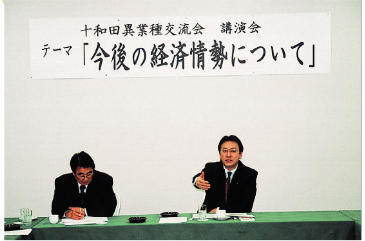
十和田異業種交流会 講演会にて