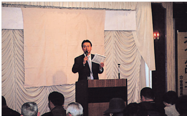
農業経営者勉強会にて