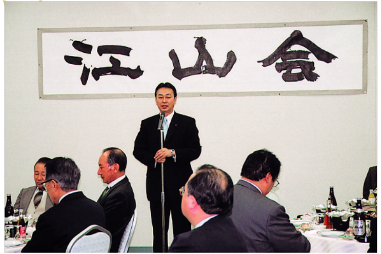
江山会 新年会にて