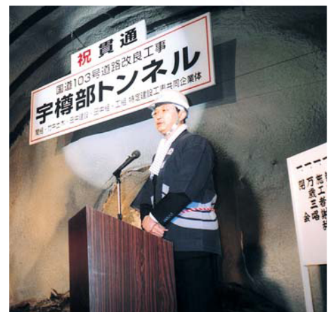
宇樽部トンネル貫通式