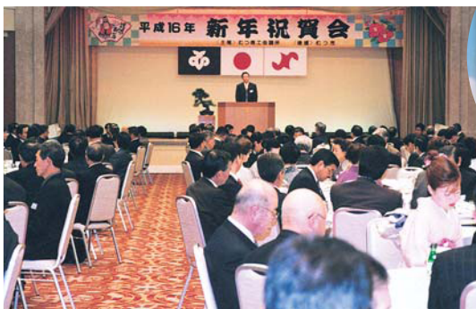
むつ地区新年祝賀会