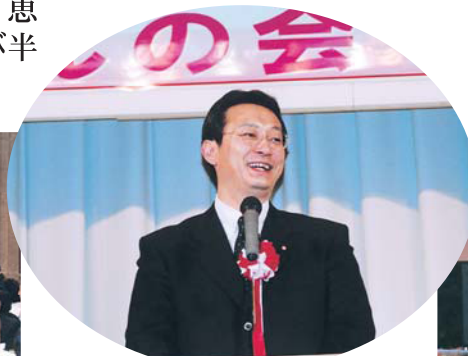
すわんの会新年会