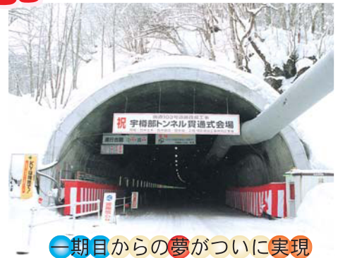
一期目からの夢がついに実現

月曜日から金曜日まで国会で公務をこなし、週末に地元入り、各式典、国政報告会、後援会立ち上げ会など数々の行事に地元を飛び廻り出席、月曜日の朝一番には新幹線で国会へ戻る生活。当選以来まだ一日も休みなく走り回り、体重も8kg減少、恵美夫人も心配半分、喜び半分？