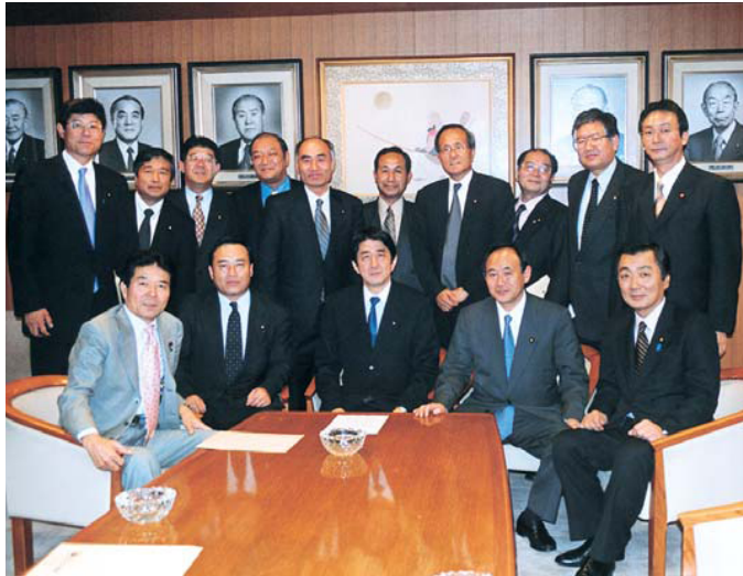
日本のみなとを考える若手議員の会