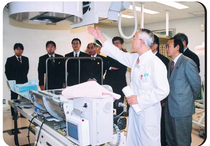
■ 民主党重粒子線医療促進議員連盟での視察(中央)

放射線によるガン治療の機械・シンクロトロンを、医療施設に誘致します。設置できれば、患者さんは手術なしに一週間程度の治療を受けられます。また、周辺の様々な雇用創出も見込めますし、医療先進地域というプラスイメージも獲得できます。エトマンはこの治療施設の誘致に全力で取り組んでいます。