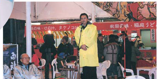
2月26日 十和田湖冬物語にて