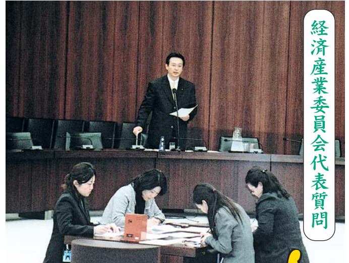
経済産業委員会代表質問