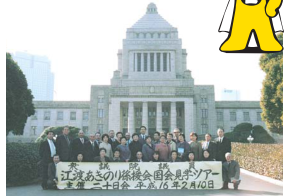
国会見学ツアー一行と