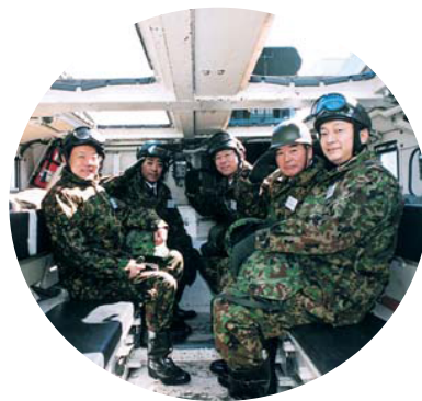
国防部会で 富士学校を視察 3月8日