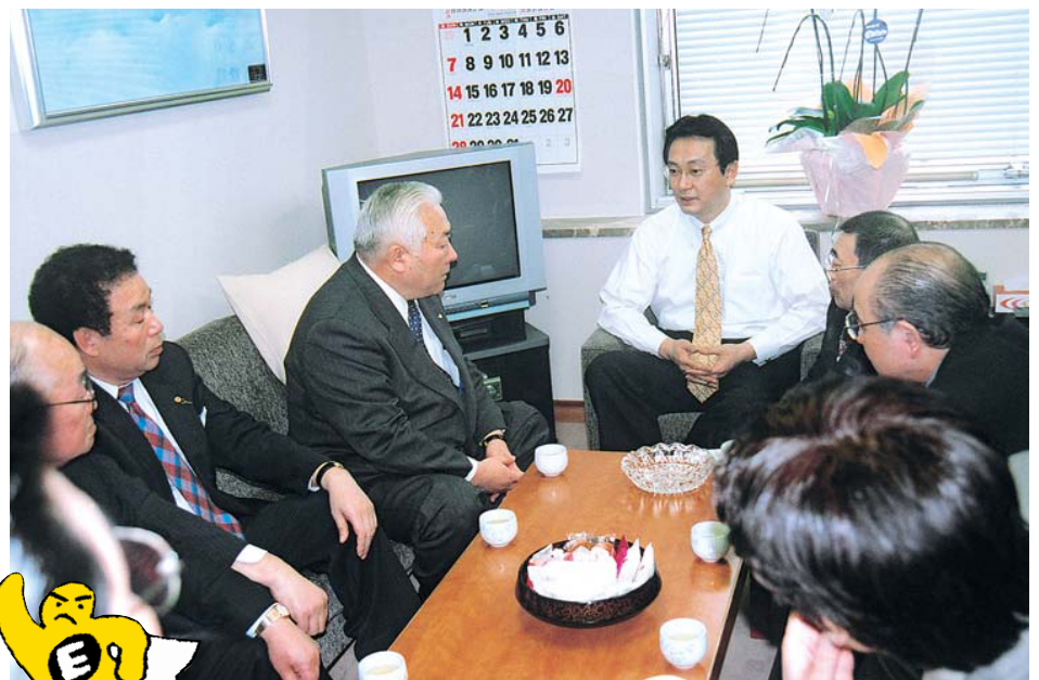
東京江渡あきのり事務所へ陳情の一駒

今エトマンは、ITER(核融合実験炉)日本誘致に懸命に取り組んでいます。ITERとは、人工太陽を作り、熱エネルギーを取り出すという原子力に替わる画期的なものです。日本に決定すれば皆様ご存知の通り六ヶ所村に施設が建つわけです。この施設に投下される予算は一〇年間で一兆6000億円地域整備も入れると、青森県、この2区内への経済効果は、2兆円を超えると言われております。地域活性化の特効薬になること間違いありません。頑張れエトマン!