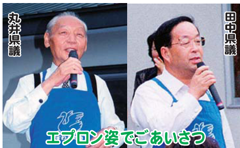
エプロン姿でごあいさつ