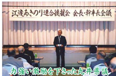
力強い激励を下された丸井県議