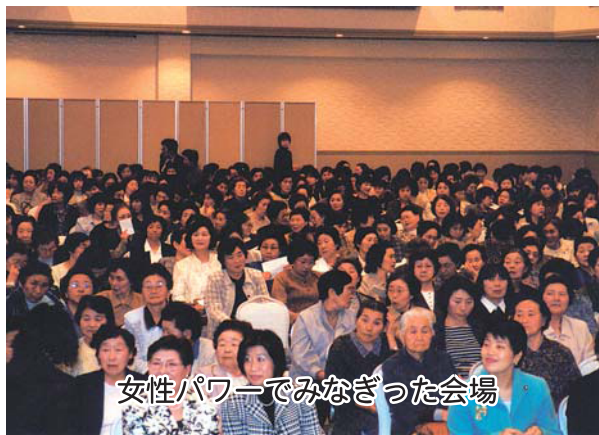
女性パワーでみなぎった会場