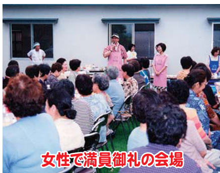
女性で満員御礼の会場