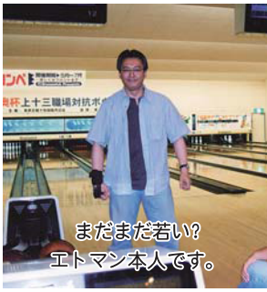
まだまだ若い？ エトマン本人です。